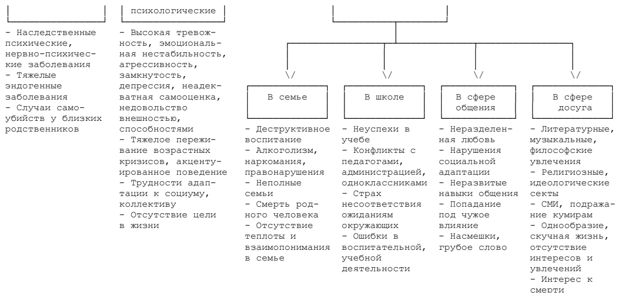
Рис. 1. Факторы суицидального риска

Группы суицидального риска - это подростки: