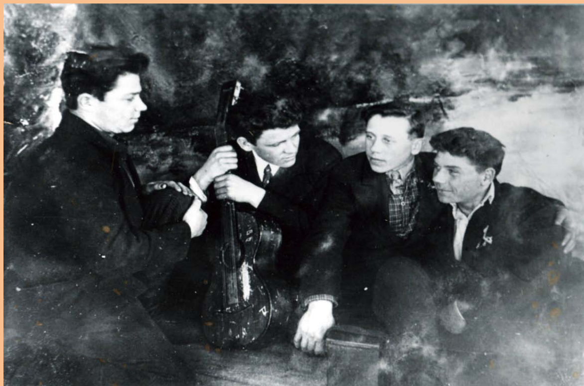
После уроков (выпускники 1939 г. )