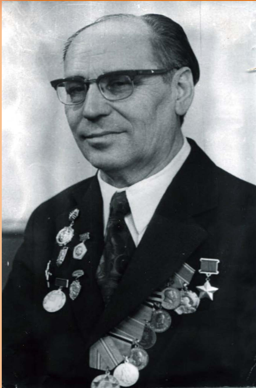
Фото 1979 года

«...Оглядываясь назад, я вспоминаю Салехард, школу, чудесных учителей, которые дали мне не только знания, но и много полезных советов, пригодившихся мне в жизни».